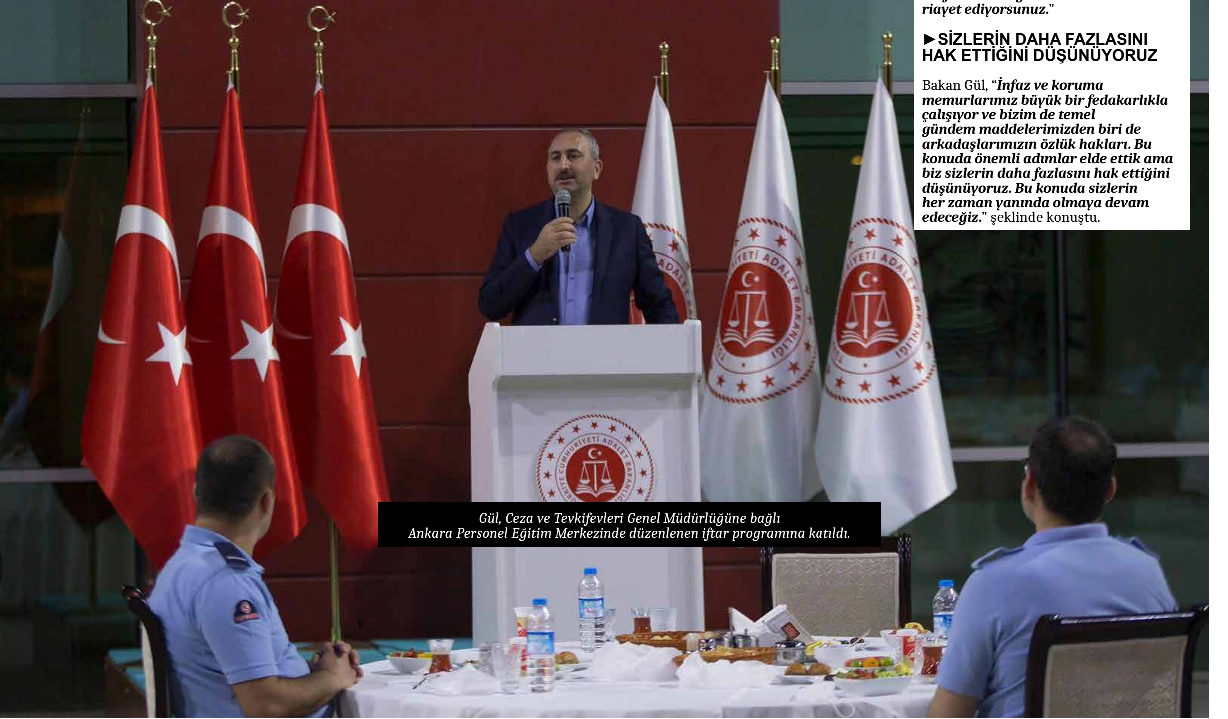
Gül, Ceza ve Tevkifevleri Genel Müdürlüğüne bağlı Ankara Personel Eğitim Merkezinde düzenlenen iftar programına katıldı.